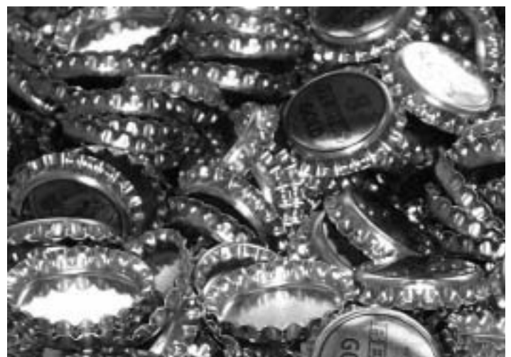
Kronkorken: Kreativer Umgang mit der Zukunft von Kindern